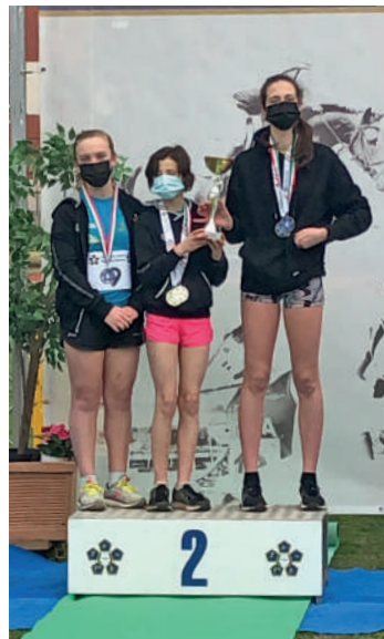
I vincitori dei campionati italiani Senior di Pentathlon Moderno tenutisi a Roma nel 2021