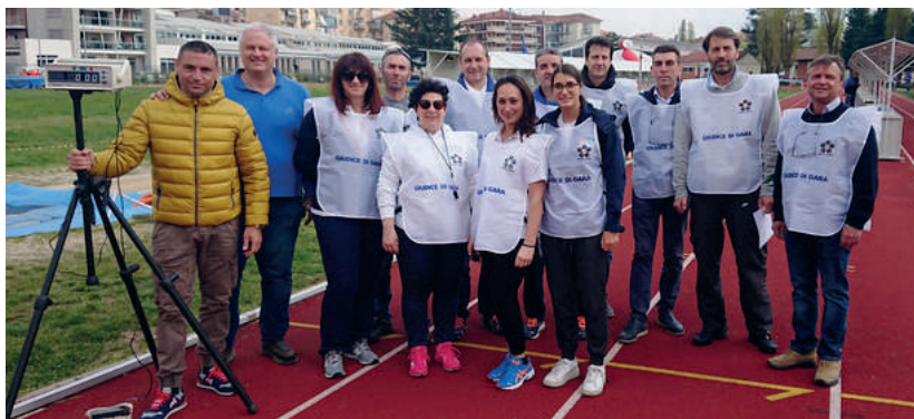
I Giudici Nazionali Pentathlon Moderno