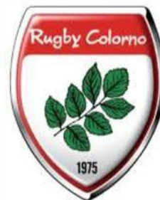
RUGBY FARNESE COLORNO